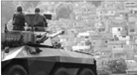
° De bovenstaande foto's zijn afkomstig uit het Braziliaanse dagblad 'O dia'.

's Avonds ging ik naar Sparta, waar ik met Pedro had afgesproken. Maar daar aangekomen, was er niemand. De nachtwacht liet mij het nieuwe dak van de club zien, dat doorzeefd was met tientallen kogels. Dat wordt dus weer niet droog voetballen als het regent! In het pikdonker liep ik langs de wijk terug naar de Rua da América, nooit was het er zo stil, nooit eerder voelde ik mij zo akelig, want ieder moment kon het schieten weer beginnen.