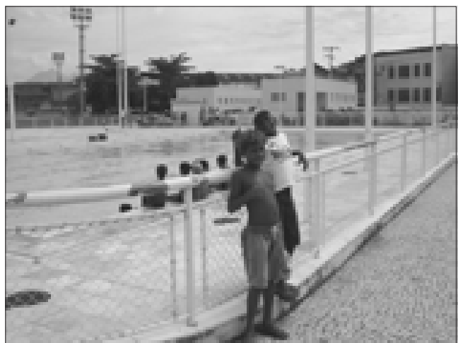
° Kinderen krijgen zwemles in 'Vila Olimpica'

Verder heb ik in januari eindelijk het Vila Olimpica in gebruik gezien. Kinderen die