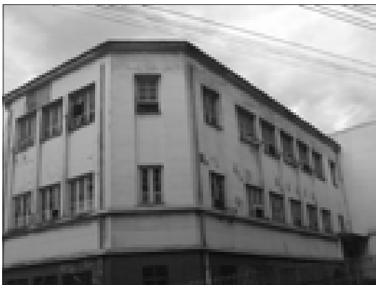
° Wordt dit het nieuwe 'Casa Nova Esperança'?

Er bleef opeens meer tijd over om energie te steken in het vinden van een nieuw huis. Nou dat laatste is goed gelukt, want wij hebben in de maand februari een ongelofelijk prachtig pand gevonden vlakbij het plein 'Central'. Op 10 maart hebben wij bij de notaris de eerste aanbetaling gedaan. Het zal ongeveer een maand duren, voordat het pand volledig op onze naam staat.